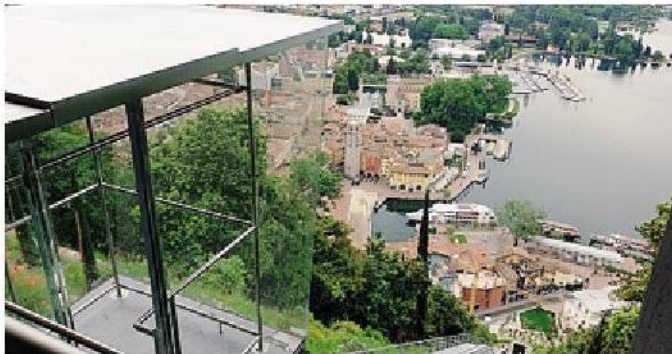
Un'immagine dell'impianto realizzato dalla Maspero Elevatori