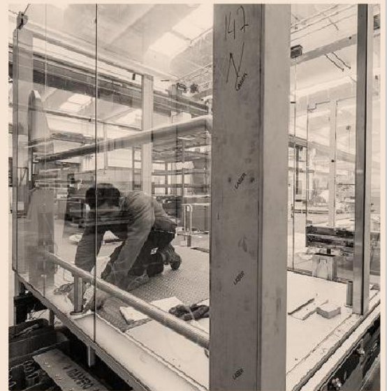
Dall'Expo alla Sagrada Familia. Gli ascensori sartoriali di Maspero sono stati scelti per diversi monumenti e palazzi di particolare rilevanza, dal British Museum di Londra al museo di arte contemporanea di Mosca. Adesso serviranno anche per salire sull'Acropoli di Atene